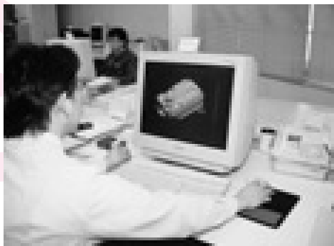
3次元ソリッドCAD・CAMシステムによる部品の試作