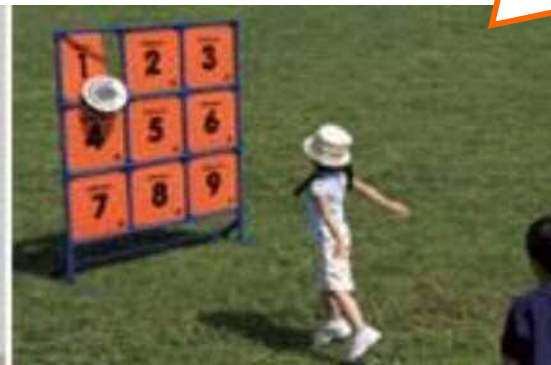
ディスクゲッター

キンボール 、 みよし鬼ごっこ 、 ふらば〜る 、 スポーツラリー は、自由に体験できます。 みよし鬼ごっこ は、2チームに分かれて相手の陣地から宝物を奪うというゲームです。