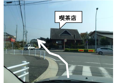
③ 喫茶店にむかって直進