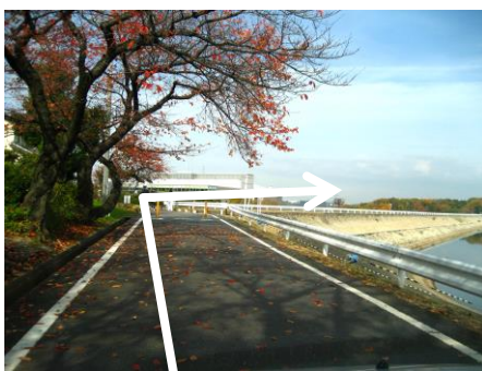
⑩ 三好池堤防方面へ右折