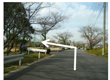
⑫ 坂をくだり、三好公園陸上 競技場内GOALへ