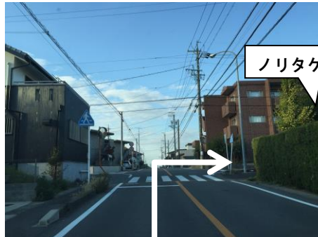
⑤ 左折後すぐの交差点を右折