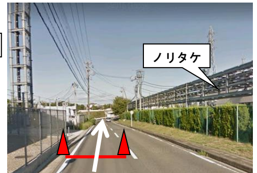
⑥ 第6走者通過地点 (駅伝スタートから95分以内に通過)