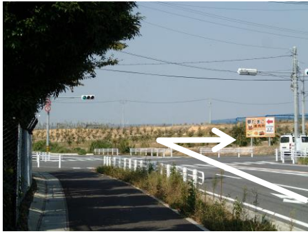
① 6区スタート後、交差点を右折