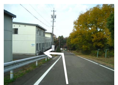
⑨ 三好池へ左折進入 道なりにすすむ