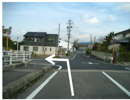
⑧ 橋を渡りきってすぐ左折 三好池方面へ