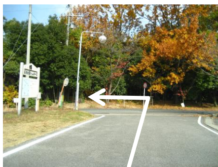
⑪ 三好池第7駐車場出入口を左折