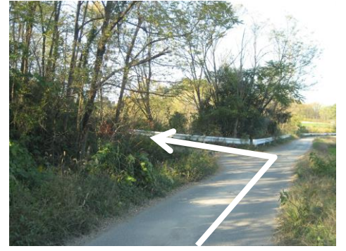
③ すぐのT字路を左折