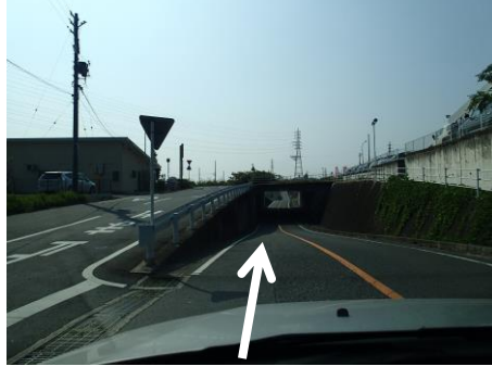
⑤ 直進して高架下をくぐる