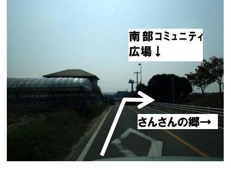
⑥ 右折してさんさんの郷と南部地区コミュニティ広場の間の道へ