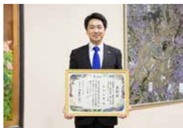
▲令和5年度気候変動アクション大賞受賞