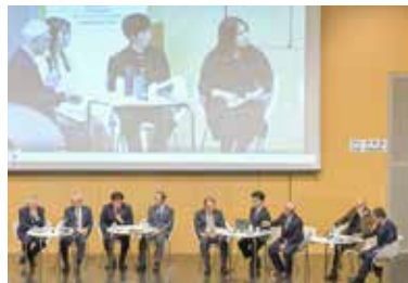
▲名古屋大学で行われた意見交換会の様子

令和5(2023)年6月22日に本市が誓約した「世界首長誓約/日本」について、「気候変動の緩和(温室効果ガスの排出抑制対策)」および「気候変動への適応(気候変動の影響による被害の回避・軽減対策)」に関して顕著な功績のあった団体として、令和5(2023)年12月4日、「先進導入・積極実践部門」での「緩和・適応分野」において、「世界首長誓約/日本」事務局と誓約自治体が環境大臣表彰「令和5年度気候変動アクション大賞」を受賞しました。