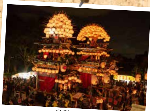
⑭ 秋の大祭 (10月14日・15日 三好八幡社)