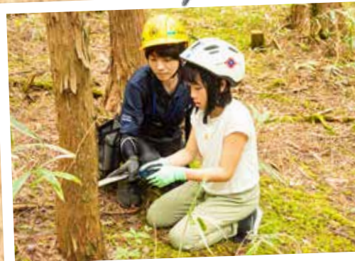
⑪ 友好の森ふれあいツアー (9月2日 長野県木曾町)