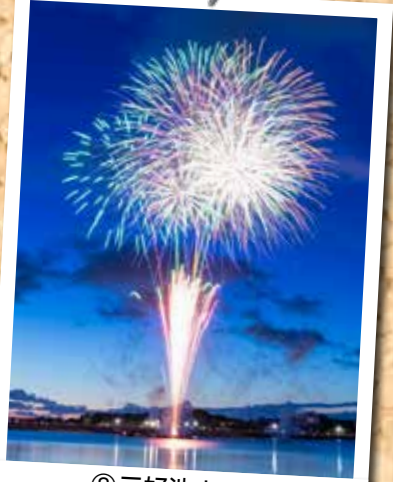
⑧三好池まつり (8月5日 三好池)