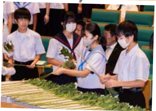
⑫平和を紡ぐつどい (9月9日 カネヨシプレイス)