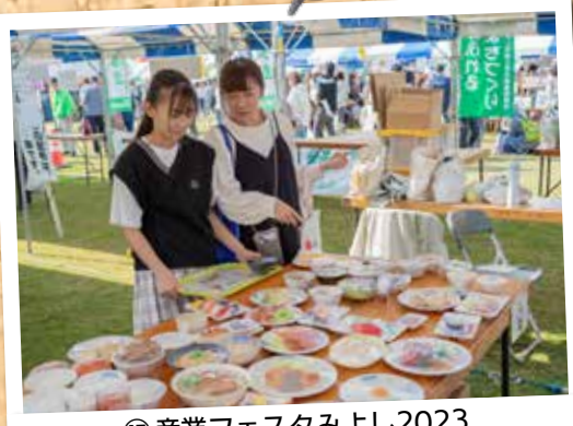
⑰産業フェスタみよし2023 (11月5日 緑と花のセンターさんさんの郷)