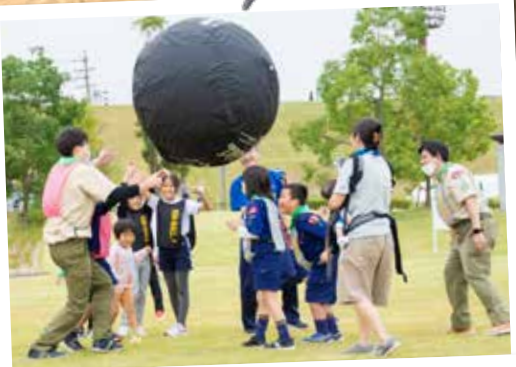
⑬みよしスポーツ祭2023 (10月8日 三好公園・三好池)