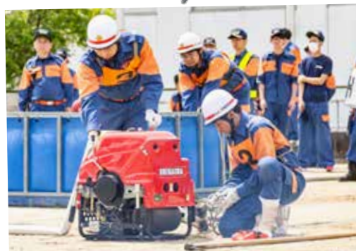
⑤ みよし市消防操法大会 (5月21日 尾三消防本部訓練場)