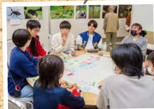
⑮ いつでもどこでもSDGs (10月27日～29日 カネヨシプレイス)