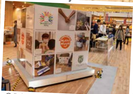
②みよし市SDGsフォトコンテスト作品展 (2月18日 イオン三好ショッピングセンター)