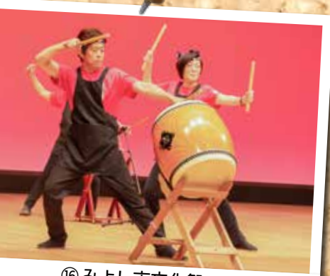
⑯みよし市文化祭 (11月2日～5日 カネヨシプレイス)