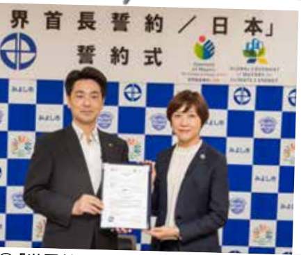
⑥「世界首長誓約／日本」誓約式 (6月22日 みよし市役所)