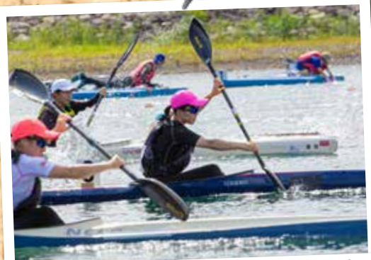
⑦全国中学生カヌースプリント選手権大会 (7月13日～17日 三好池カヌー競技場)