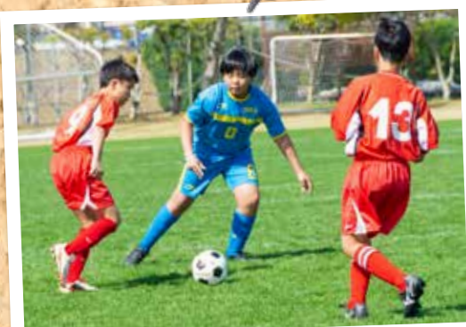
③土別市との小学生スポーツ交流 (3月25日～28日 旭グラウンド他)