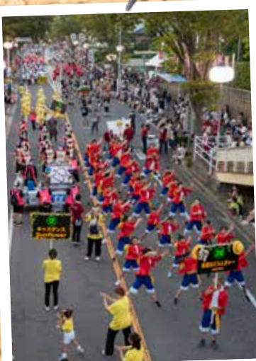
⑨ 三好いいじゃんまつり (8月19日 三好稲荷閣周辺道路)