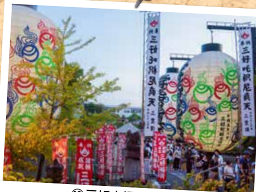
⑩ 三好大提灯まつり (8月19日・20日 三好稲荷閣)