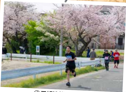
④ 三好池桜マラソン (4月2日 三好池)