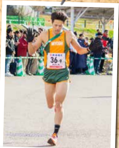
⑱第16回愛知駅伝 (12月2日 愛・地球博記念公園)