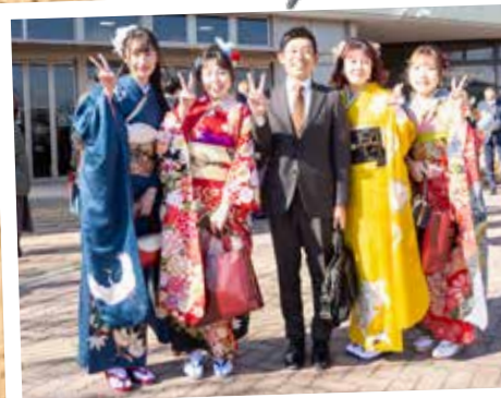
① 20歳の成人式 (1月8日 カネヨシプレイス)

2023年は新型コロナウイルス感染症が5類に緩和され、徐々に元の生活を取り戻した1年になりました。さまざまな出来事があったみよし市の2023年を写真で振り返ります。皆さんはどんな1年になりましたか？