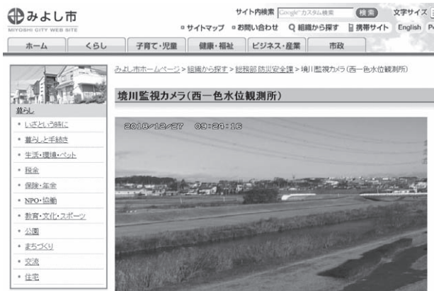
▲市ホームページから確認できる境川監視カメラの映像

さらに、子ども医療費支給対象者の拡充については、平成31年度から入院費の支給を18歳まで拡充できるよう取り組んでいます。 また、政策4に掲げています「産業の振興による財政基盤の安定したまち」づくりにおいては、企業立地などによる安定した財源の確保を目指して、福田行政区内の池下地区において、工業団地造成事業を進めています。 その他、防災面においては、境川の水位監視カメラの映像配信事業を開始しました。また、環境にやさしいまちづくりにおいては、小中学校の屋根を貸し出し、太陽光パネルを設置する省エネルギー対