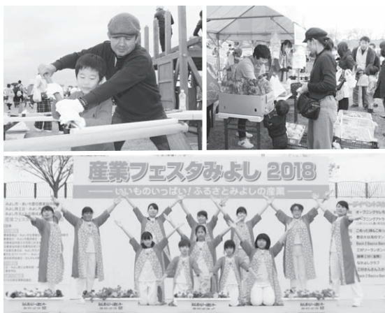
▲産業フェスタみよし

ご来場いただきました皆さまには、みよしの産業を肌で感じるとともに、楽しい一日をお過ごしただけだと思えます。ご協力をいただきました、多くの関係者の皆さまに深く感謝を申し上げます。