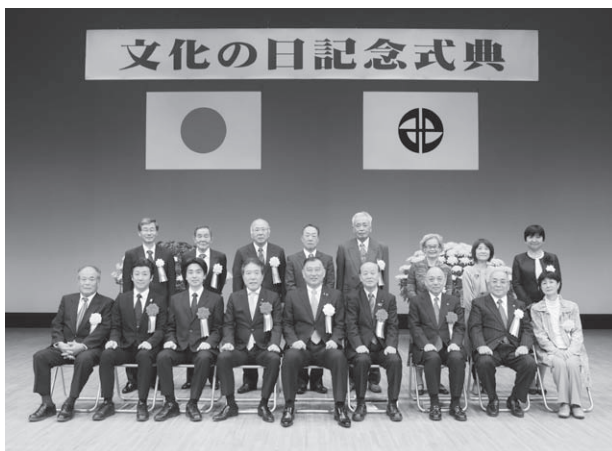
▲文化の日記念式典

11月3日に開催しました「文化の日記念式典」では、自治産業、教育福祉などの各分野において、「ふるさとみよし」の発展や文化芸術の振興に大きく貢献をいただいた皆さまに、表彰、感謝状の贈呈という形で顕彰をさせていただくことができました。皆さまに心より感謝を申し上げるとともに、その功績に対して、深く敬意を表します。