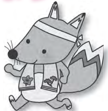
▲みよし市健康づくりキャラクター「キューちゃん」

市の健診を上手に活用し、また、体を動かしたりバランスの良い食生活を心掛けるなど、健康管理につとめましょう。