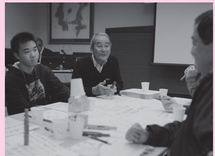
▲参加者はそれぞれのグループに分かれ、いいじゃんまつりをもっと盛り上げるべく、活発な意見交換を行いました