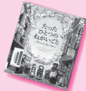
『たったひとつのねがいごと』 バーバラ・マクリントック / 作 福本友美子 / 訳

学校をズル休みしているけんごのところへやってきたのは、友達のせいぎ。「今日も学校休むのかよ」と言うせいぎに、けんごは「妖怪のせいぎで行けない」と言い出して…。笑いと友情の妖怪絵本です。