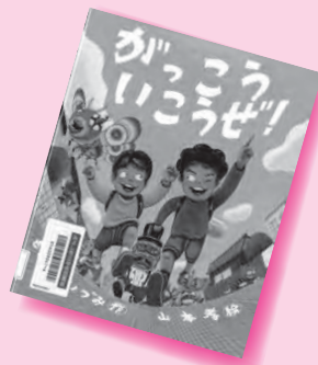
『がっこういこうぜ!』 もったいなくした 山本孝 / 絵

ホームページ(㊟ http://www.city.aichi-miyoshi.lg.jp/library/index.html )で新着図書の検索ができます。