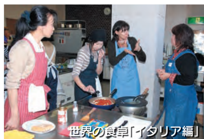
世界の食卓「イタリア編」

財団法人三好町国際交流協会(MIA)から 学習交流センター内 ☎(34)9000 ㊟(34)9001 ✉miyo-in@hm.aitai.ne.jp