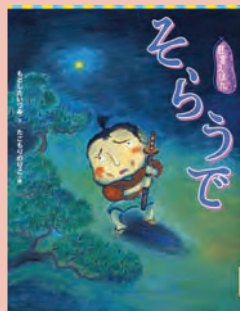
『そらうで』 もつたみつあき/作 たむりみつあき/絵

秋のある日、おじいちゃんのさつまいも畑にいもほりにやってきたあきちゃんとはるくん。土の下には、どんないもがかくれているかな? 秋の味覚を味わうような絵本です。