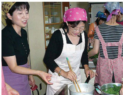
生活創造講座「作ってみよう三好の味」

平成21年1月から開催する新春講座の受講者を募集します。この機会に、余暇を有意義に活用して楽しく学びませんか。