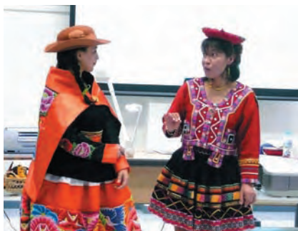
国際理解講座「異文化探検」