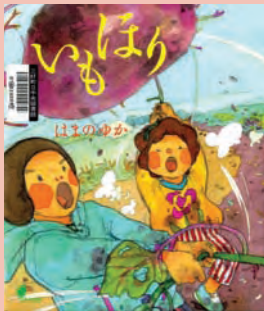
『はまのゆか』 はまのゆか/作・絵

ホームページ( http://www.town.aichi-miyoshi.lg.jp/library/ )で新着図書の検索ができます。