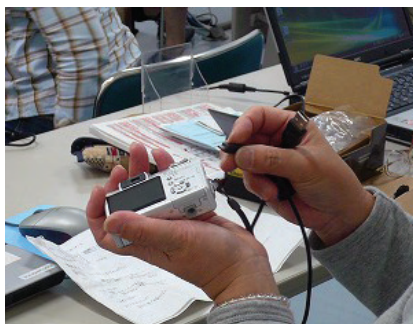
情報・通信講座「デジカメ」