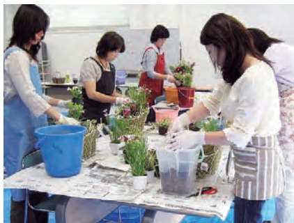
暮らしの中のガーデニング講座

平成20年9月から開催する秋冬講座の受講者を募集します。この機会に、余暇を有意義に活用して楽しく学びませんか。