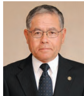
三好上 ○しばた たかみつ ☎(32)1001 (三好上公民館)