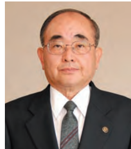
三好下 ののやま みきひろ ☎(32)1053 (三好下公民館)