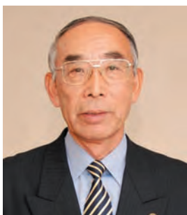
三好丘桜 さほり もりひで 佐堀 守秀 ☎(36)1213 (三好丘桜集会所)