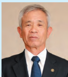
明知上 ふかや しょうじ ☎ (34)3055 (明知上区事務所：公民館)