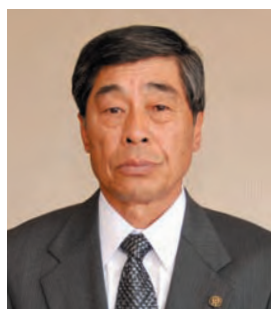
蒔生 ◎清水 義則 ☎ (32)1693 (蒔生公民館)