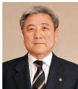
新屋 く の ひであき ☎ (34)0751 (新屋児童館)