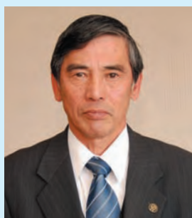
明知下 ふかや しょうろ ☎ (32)1009 (明知下区事務所：公民館)