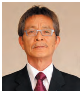
福谷 すずき しんじ ☎ (36)1690 (福谷公民館)