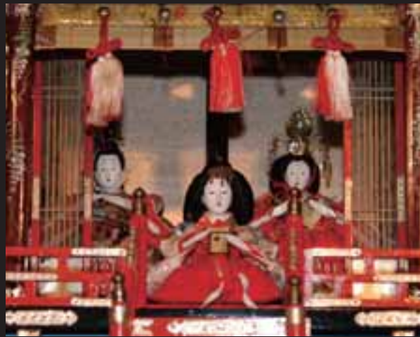
▲三人官女 さんにかんじょ ：お内裏様の食事など身の回りの世話をする宮廷の女官。御殿飾りでは、男びな、女びなと共に御殿内に入っている場合が多い。

▶御殿飾りひな人形(昭和時代、知多市歴史民俗博物館蔵)：昭和以前のひな人形は、男びなと女びなの座り位置が現在と逆になっていた。昭和天皇の即位式の際に天皇が向かって左側に座ったことになって、それ以降のひな人形の座り位置が現在のように、向かって左が男びな、右が女びなになった。