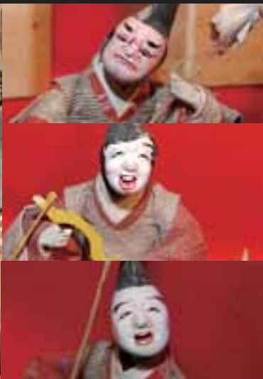
▲仕丁：雑役を行う男性の人形。 日傘、靴台、雨傘などを持っている。怒り・笑い・泣き上戸の表情から、三人上戸という別名がある。