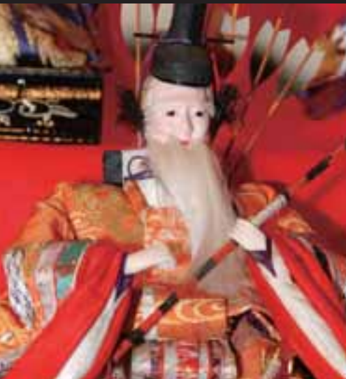
▲隨身 すいしん ：若武者と年寄り武者のペアで、年寄りの方が女びなを守る。これは、若い隨身が女びなと恋仲にならないようにとの説もある。年寄りが左大臣で知性と学問を司る象徴といわれる。