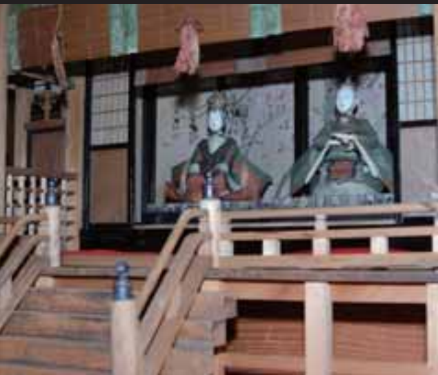
▲御殿飾りひな人形(江戸時代、知多市歴史民俗博物館蔵)：初期の御殿は、実際の貴族の屋敷がモデル。 白木で簡素だが手の込んだ作りのものが多い。

3月3日はひな祭り(桃の節句)です。資料館では、昭和57年の開館以来毎年ひな人形展を開催。今年で26回目を迎える今回は、御殿飾りひな人形を中心に展示紹介しています。華やかな御殿飾りの移り変わりを感じに、ぜひお出掛けください。