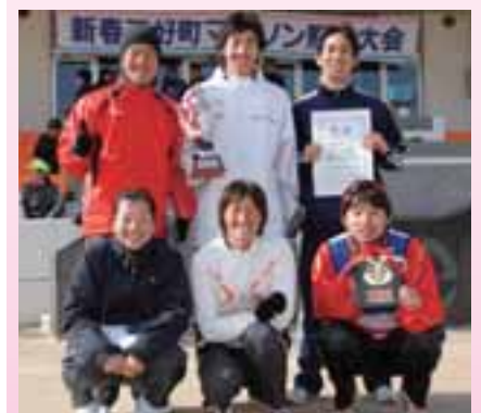
一般フリー優勝(三好SATC-勝負チーム)

みんなが最高の走りのできたことが勝因。ここをホームグラウンドとして日ごろから練習しているので、ぜひとも勝たなかったです。来年は3連覇を目指して、さらに勝利を続けたいです。