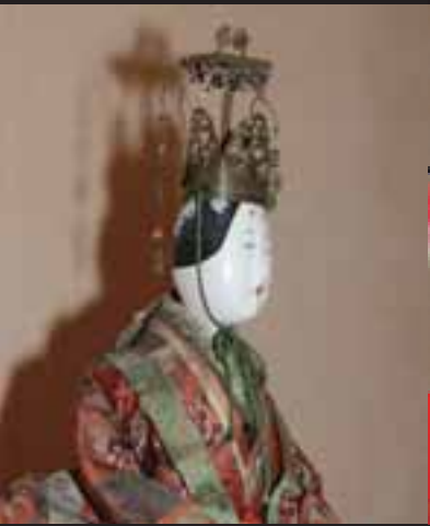
▲内裏ひな人形(江戸時代)： 江戸時代のひな人形。およそ 200年前のもの。