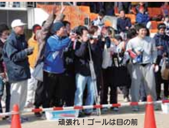
頑張れ！ゴールは目の前