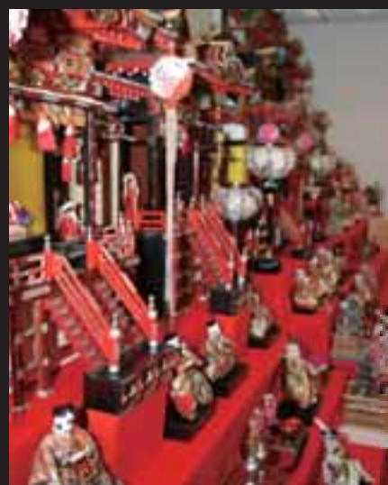
▲きらびやかな御殿飾りひな人形(昭和時代)の数々が並ぶ。