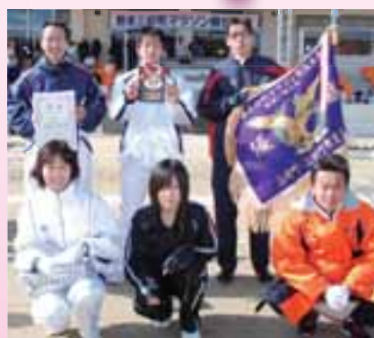
地区対抗一般優勝(新屋Aチーム)

練習は、普段からそれぞれの部活動で走っていました。みんなが協力して、それぞれの区間を全力で走り抜いたことが結果につながりました。まさか優勝できるとは思っていなかったのでもううれしいです。