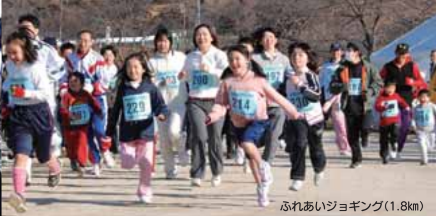
ふれあいジョギング(1.8km)