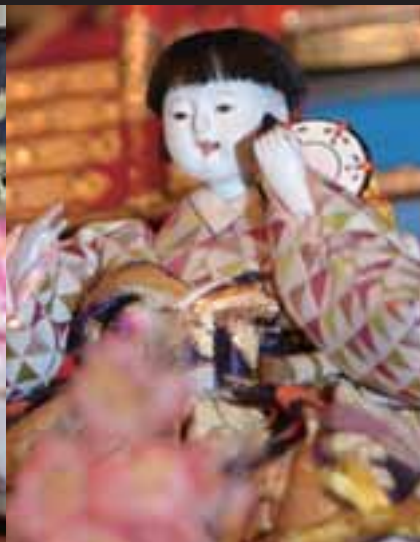
▲五人囃子 ごにんばやし ：能楽の舞台と同じく、向かって右から楽器の音の小さい順に並んでいる。