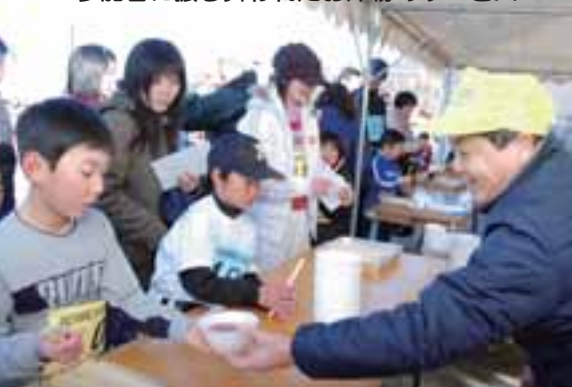
参加者に振る舞われたお汁粉のサービス