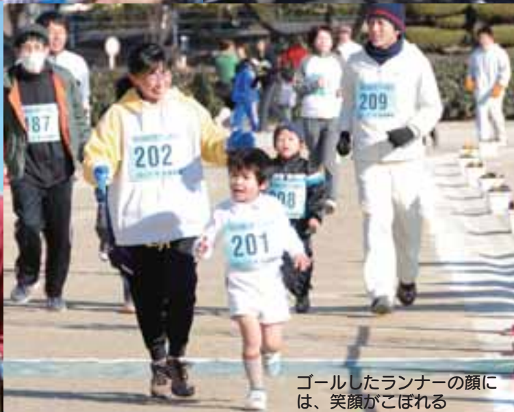
ゴールしたランナーの顔には、笑顔がこぼれる