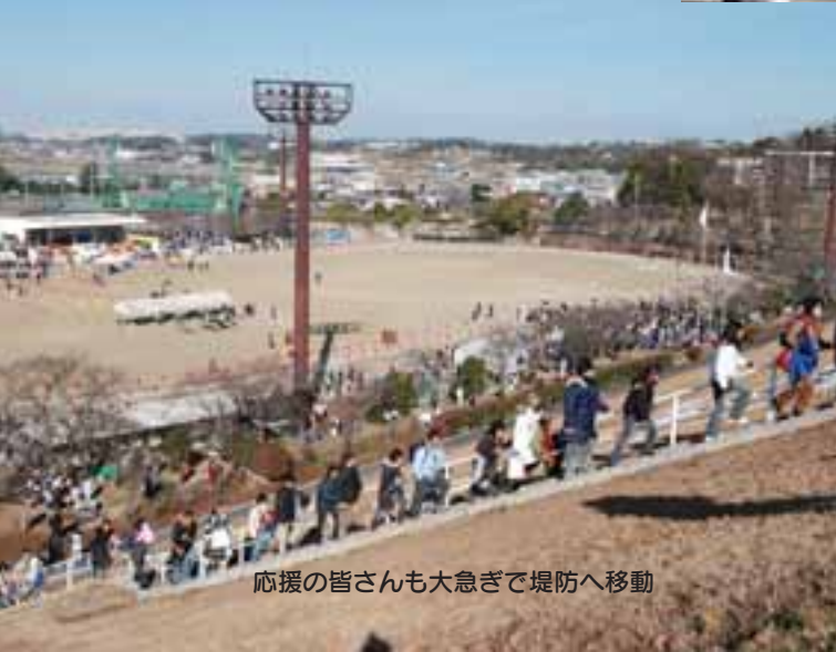
応援の皆さんも大急ぎで堤防へ移動