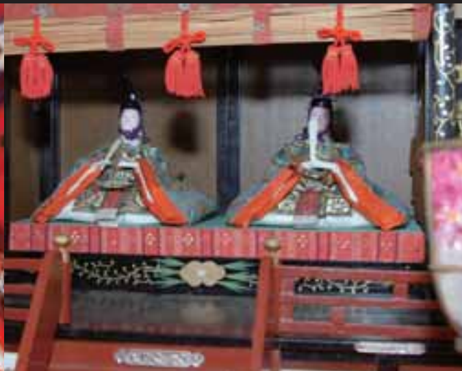
▲御殿飾りひな人形(昭和時代、田原市渥美郷土資料館蔵)：渥美半島を中心とした東三河には、ひな祭りの日に、男の子のために学問の神様の天神様(菅原道真)の人形を飾る風習がある。御殿の中に天神様が2体入っている珍しい御殿飾りひな人形。