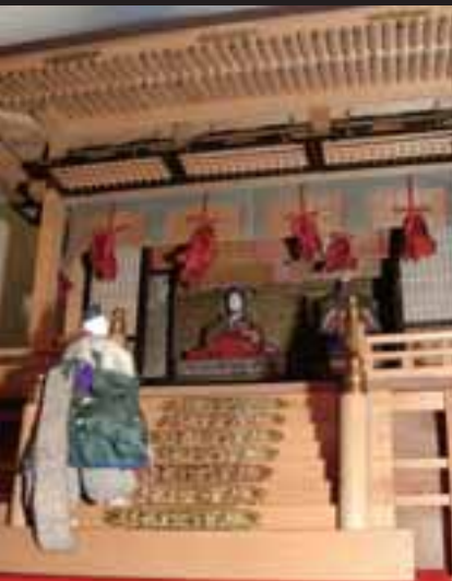
▲御殿飾りひな人形(明治時代)： 白木の大きな御殿が特徴的。 立ち姿の男びなが珍しい。