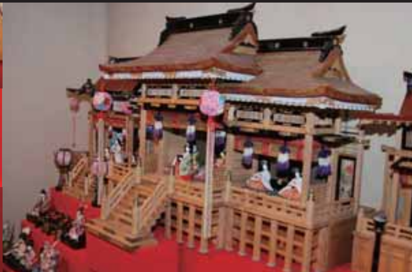
▲御殿飾りひな人形(昭和時代、田原市渥美郷土資料館蔵)