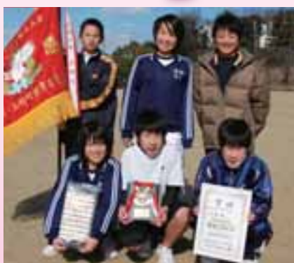
地区対抗中学優勝(三好丘緑Aチーム)

みんなが最高の走りのできたことが勝因。ここをホームグラウンドとして日ごろから練習しているので、ぜひとも勝たなかったです。来年は3連覇を目指して、さらに勝利を続けたいです。