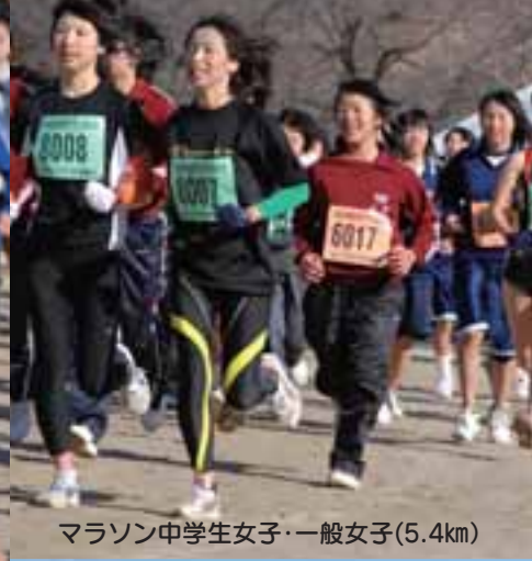
マラソン中学生女子・一般女子(5.4km)