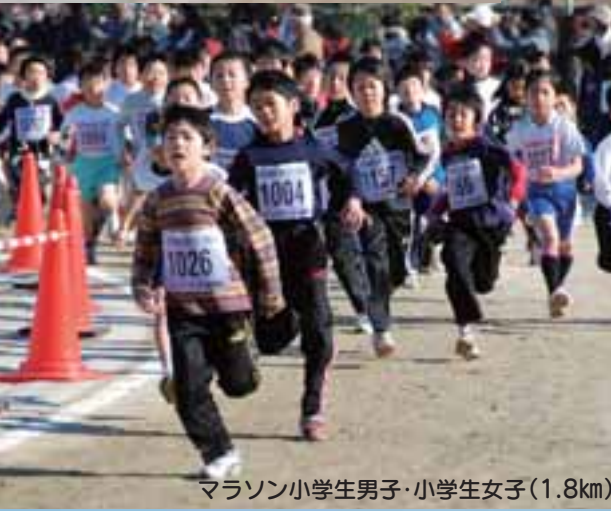
マラソン小学生男子・小学生女子(1.8km)