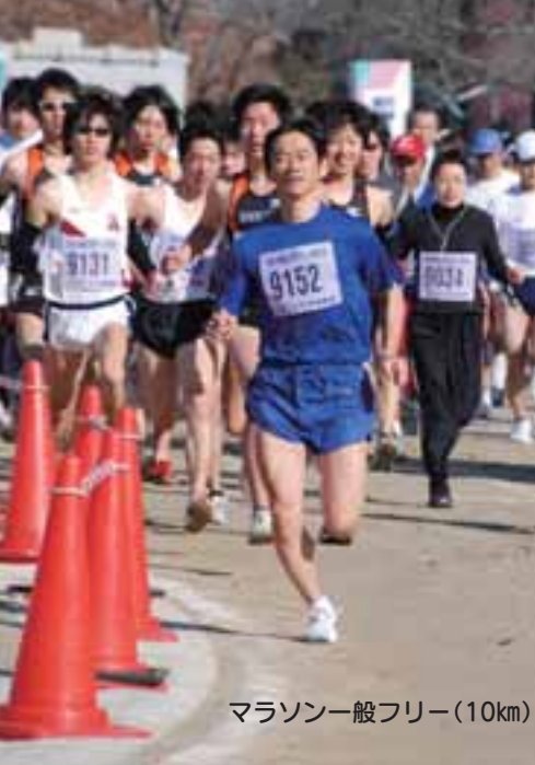
マラソン一般フリー(10km)