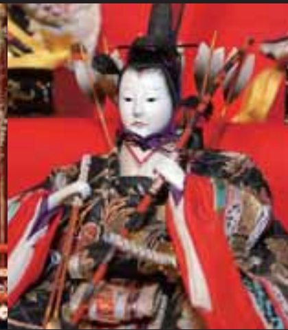
▲隨身 すいしん ：左大臣・右大臣とも呼ばれる、お内裏様のガードマン役。若武者は右大臣で力を司る象徴といわれる。