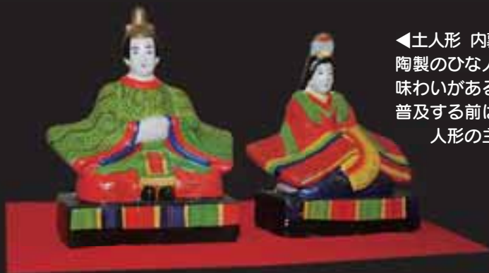
◀土人形 内裏びな(昭和時代)：陶製のひな人形。やわらかい曲線に味わいがある。御殿飾りひな人形が普及する前は、にな祭りで飾られる人形の主役だった。