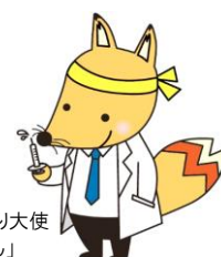
みよし市健康づくり大使 「キューちゃん」