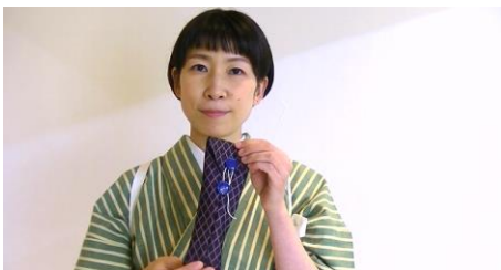
まずは簡単なペンケース