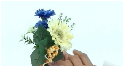
かわいいコサージュ