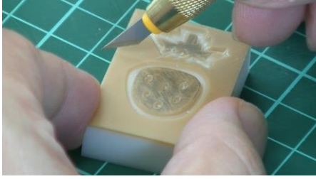
まずは簡単なイチゴのはんこ