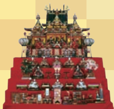
御殿飾りひな人形 (昭和29年)