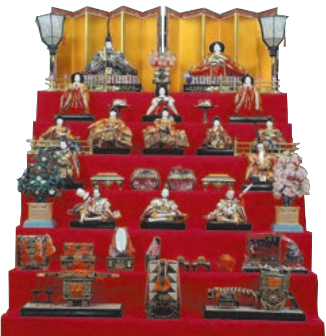
屏風段飾りひな人形 昭和49年