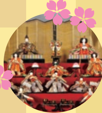
屏風段飾りひな人形 (平成元年)