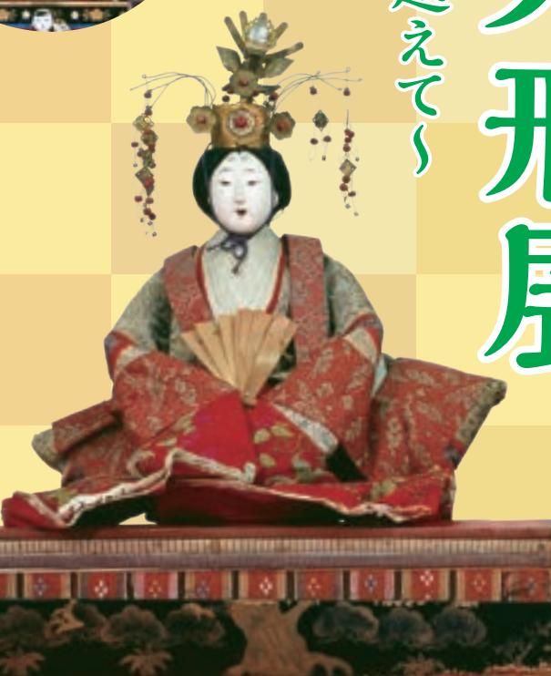
内裏ひな人形 (明治39年)