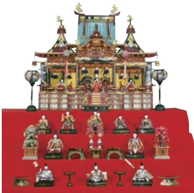
御殿飾りひな人形 昭和29年