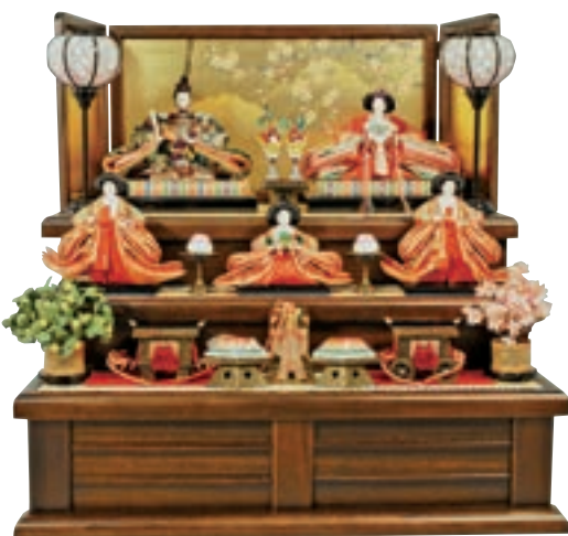
屏風段飾りひな人形 平成15年

当館は昭和57年11月に開館し、2回目の企画展示として昭和58年1月に「ひなまつりと能楽展」を開催いたしました。以来、毎年ひな人形展を開催し、今回で42回目を迎えました。この間に実に多くの皆さまからひな人形のご寄贈を賜りました。改めてご寄贈賜りました皆さまをはじめ、ご支援・ご協力を賜りました皆さまに、厚く御礼申し上げます。