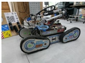
レスキューロボット