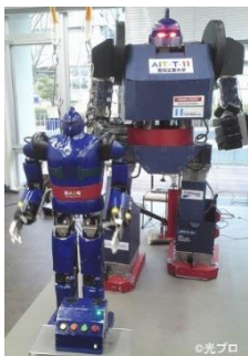
大型ヒューマノイド 二足歩行型ロボット